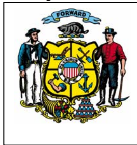
PSC of Wis. 12/2009

Elija su equipo y dónde quiere comprarlo. Use el cupón (como un cheque) para pagar al vendedor su equipo de calificación especial. Usted paga: 1) $100 (a menos que sea calificado TAP o use un cupón HH); 2) por cualquier compra sobre la cantidad total del cupón más sus $100; y 3) por cualquier producto que compre no calificado.